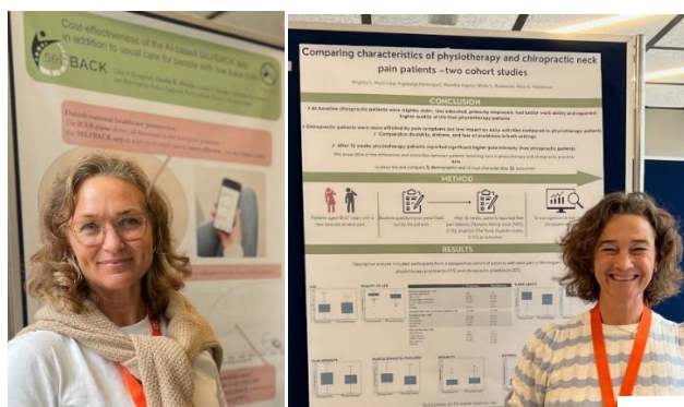
Her bilder fra poster-presentasjonene

Flere ELIB-forskere var nettopp i Groningen i Nederland for å presentere sin forskning, for å høre om det siste innen nakke og rygg forskning, delta på workshops og treffe kollegaer fra hele verden